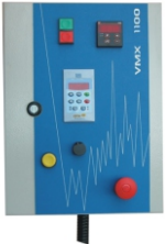
Painel de comando

O VMX-1100 é um simulador de transporte de pequeno porte destinado aos processos de desenvolvimento e controle da qualidade de embalagens.